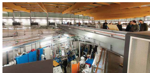
SOLEIL, un centre de recherche ouvert tous les jours à tous les publics.

dans un centre de recherche. La poursuite d'un partenariat depuis 10 ans avec le Rectorat de Versailles est, en la matière, totalement indispensable. L'éducation non formelle collabore et complète ainsi le travail des enseignants, partie prenante du dispositif. Pour SOLEIL le respect de tous les savoirs, de toutes les démarches, académiques ou auto-didactes, guide la relation au quotidien. L'expérience de 10 ans de médiation contredit le leitmotiv de la défiance du public envers la science et les scientifiques.