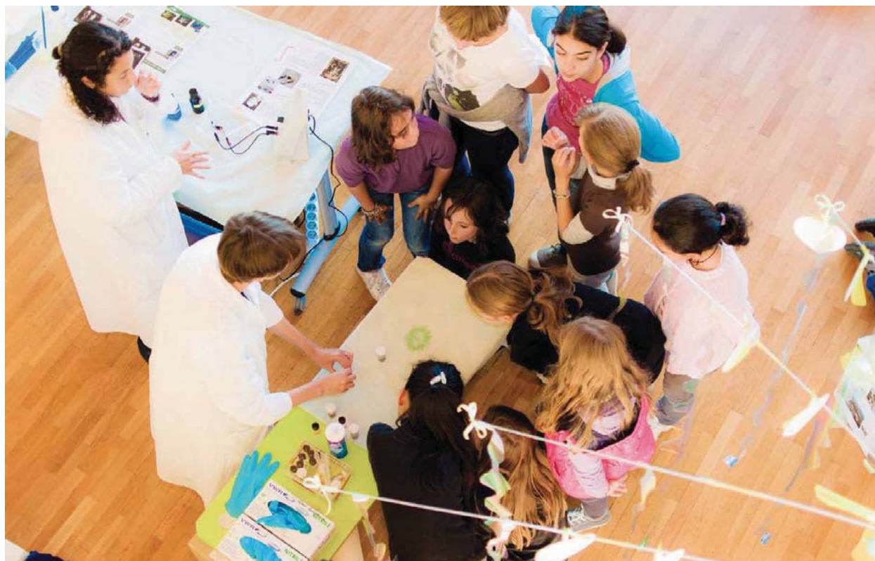
Des outils de travail et de découverte pour tous.

L ieu de l'interdisciplinarité, SOLEIL a voulu répondre aux attentes de ses actionnaires et des ses partenaires en devenant un lieu d'échange et de diffusion de la culture scientifique et technique pour tous. SOLEIL est ainsi accessible tous les jours depuis le démarrage du projet en 2002 et développe des actions scientifiques, pédagogiques et grand public, en partenariat avec les acteurs les plus mobilisés dans le domaine : les Rectorats (plus particulièrement les Rectorats de Versailles et Orléans-Tours), les établissements scolaires, les associations, les collectivités territoriales, les médiathèques... Démystifier, décloisonner, participer à la transmission des connaissances, un autre travail de tous les jours pour les équipes de SOLEIL qui proposent à chacun de découvrir et de s'appropriier à son rythme la science en train de se faire.